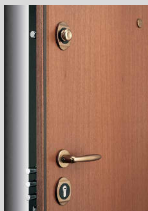
Pannello tanganica maniglia brunita