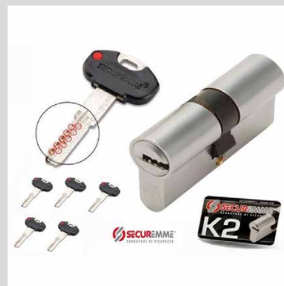
Cilidro K2 I+5 chiavi