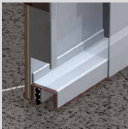
Soglia mobile parafreddo