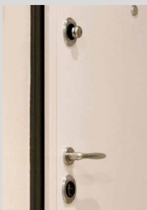
Pannello bianco maniglia argento