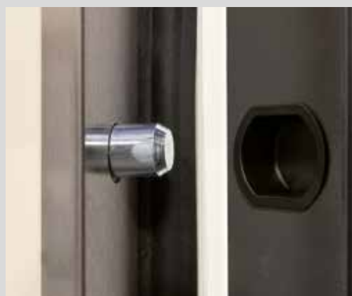
Rostro fisso di sicurezza