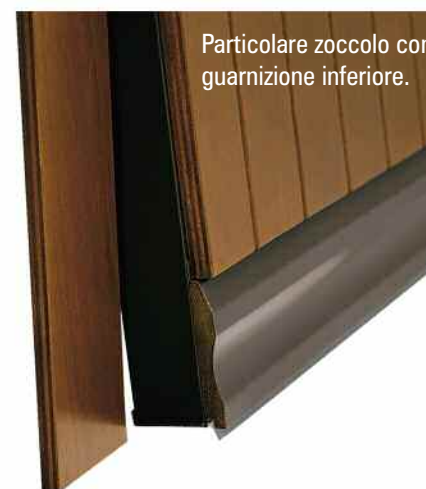
Particolare zoccolo con guarnizione inferiore.