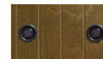
Particolare bocchette areazione.