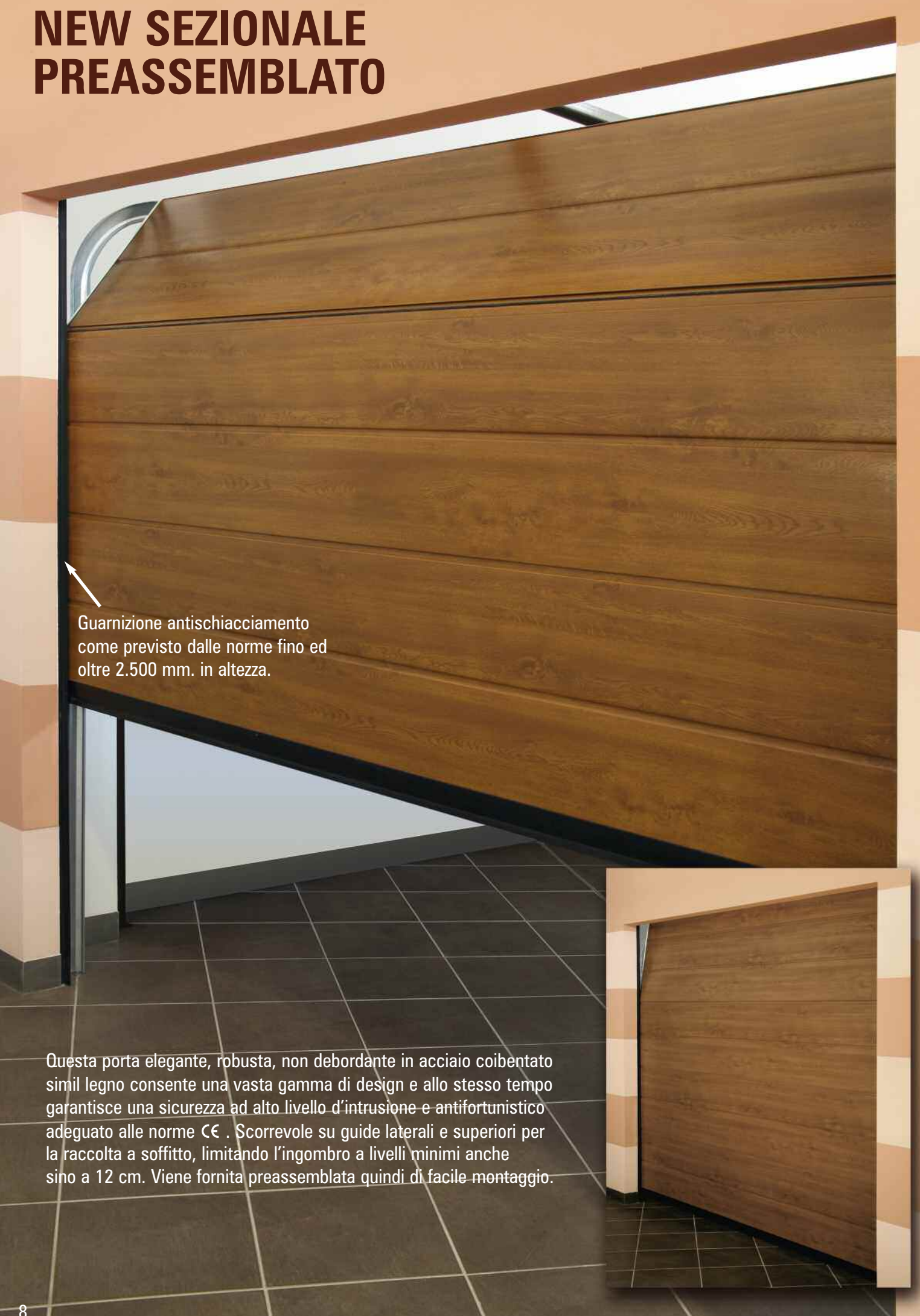
Guarnizione antischacciamento come previsto dalle norme fino ed oltre 2.500 mm. in altezza.

Questa porta elegante, robusta, non debordante in acciaio coibentato simil legno consente una vasta gamma di design e allo stesso tempo garantisce una sicurezza ad alto livello d'intrusione e antifortunistico adeguato alle norme CE. Scorrevole su guide laterali e superiori per la raccolta a soffitto, limitando l'ingombro a livelli minimi anche sino a 12 cm. Viene fornita preassemblata quindi di facile montaggio.