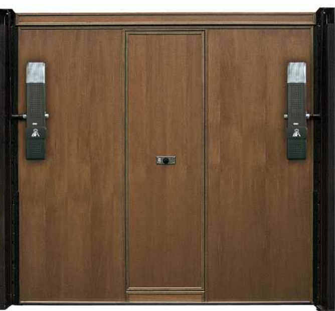
Vista interna porta basculante rivestita motorizzata con due motori e portina a passo d'uomo.

Struttura in acciaio zincato e preverniciato, particolarmente robusta, così come tutti gli accessori, le staffe portacuscinetti, cuscinetti, cavi d'acciaio certificati, traversi di rinforzo. Spalle composte in struttura metallica adeguatamente rinforzate a seconda della grandezza e del peso della porta, tutte le porte sono munite di PARACADUTE DI EMERGENZA a norme CE che in caso di anomalie interviene evitando la caduta del telo.