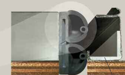
Particolare guarnizione antiscivolo in base alla direttiva macchine UNI-EN.