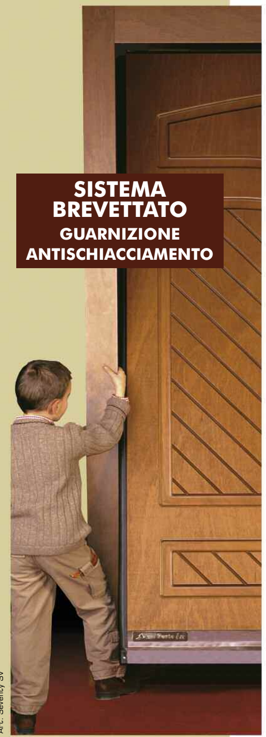
Aut.: Seventy SV

Nelle porte versione manuale è posta su ambo i lati e per tutta l'altezza con la funzione passiva atta a proteggere l'eventuale schiacciamento delle dita.