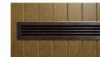
Particolare griglie areazione.