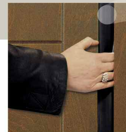
Particolare guarnizione sicurezza passiva.