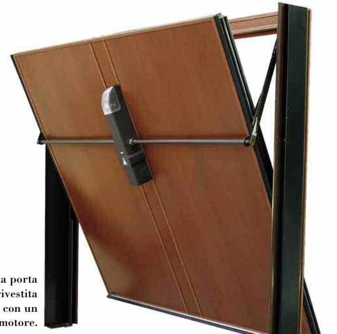
Vista interna porta basculante rivestita motorizzata con un motore.

Loc. Rio Basco, 18 A - 17044 - Stella San Giovanni (SV) - Tel. 019.703101 Fax 019.703053 www.fracchiasrl.it info@fracchiasrl.it