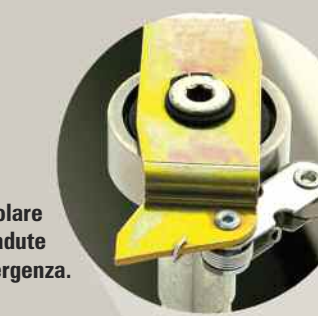
Particolare paracadute di emergenza.